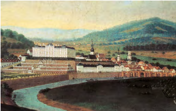
Saarbrücken um 1775 - rechts hinten der weiße Turm der Ludwigskirche

Die Ludwigskirche hat als Bauwerk ereignisreiche 250 Jahre hinter sich. Vor allem im 19. und 20. Jahrhundert erlebt die Kirche viele Veränderungen: Der weiße Außenputz verschwindet schon früh, wahrscheinlich um 1830. 1886 werden die Familien-