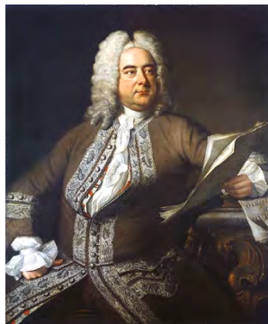
Thomas Hudson (1701-1779): G.F.Händel 1749

Händels „Coronation Anthems“ sind vier geistliche Chorwerke, die er 1727 zur Krönung des englischen Königs Georg II. komponierte. Das bekannteste Stück „Zadok the Priest“ wurde seitdem bei jeder Krönung eines englischen Monarchen gespielt, zuletzt auch 2023 bei der Krönung Charles III. Ein „Anthem“ ist ein spezifisches Stück der Liturgie der anglikanischen Kirche, das auf einem Bibeltext basiert. In der Regel sind es kürzere, aber komplexere Stücke, deren Rolle im Gottesdienst vielleicht am ehesten mit der einer Motette verglichen werden kann.