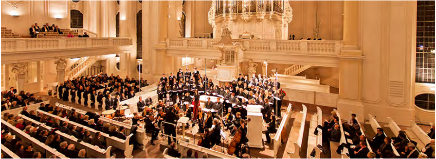
Chor und Orchester der Universität des Saarlandes in der Ludwigskirche